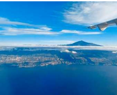
Mehr als 300 Sonnentage pro Jahr machen die Kanaren zum Sehnsuchtsort